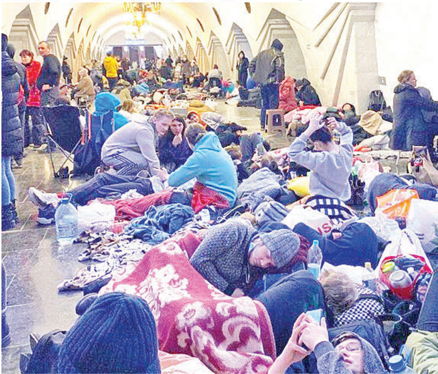
乌克兰哈尔科夫地铁站挤满躲避战火的人民